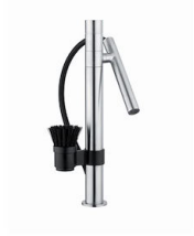
Mischbatterie Bert 8428 100