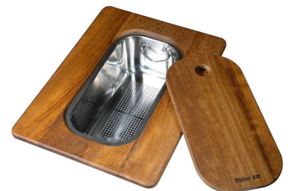
Schneidebrett Twin aus Iroko-Holz mit Küchensieb aus Edelstahl

* nur in Kombination mit dem Zubehör 8644 101