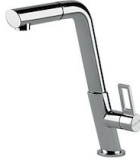
Mischbatterie KE 8492 000